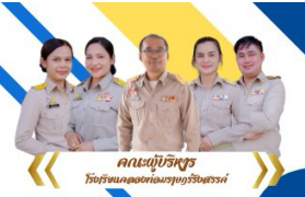
คณะผู้บริหาร โรงเรียนคลองท่อมราชบุรีรังสรรค์