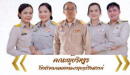
คณะผู้บริหาร โรงเรียนคลองท่อมราชบุรีรังสรรค์

สำนักงานเขตพื้นที่การศึกษามัธยมศึกษาต่ง ระเบียบ ข่าวประชาสัมพันธ์ โรงเรียนคลองท่อมราชบุรีรังสรรค์