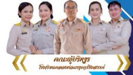
คณะผู้บริหาร โรงเรียนคลองท่อมราชบุรีร้งสรรค