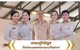
คณะผู้บริหาร โรงเรียนคลองท่อมราษฎร์รังสรรค์